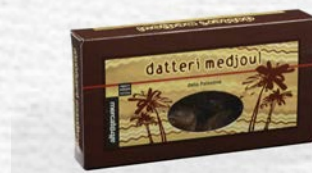
DATTERI MEDJOU AL NATURALE 200 GR