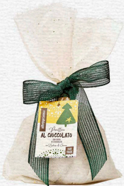
PANETTONE AL CIOCCOLATO CON GOCCE DI CIOCCOLATO 700 GR