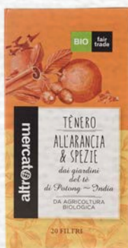
TÈ NERO ALL'ARANCIA E SPEZIE 20 FILTRI BIO - 40 GR