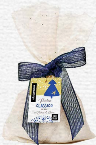
PANDORO CLASSICO CON ZUCCHERO A VELO DI CANNA 700 GR