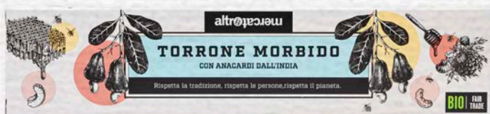
TORRONE MORBIDO CON ANACARDI TOSTATI BIO - 90 GR