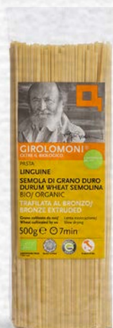
LINGUINE PASTA DI SEMOLA BIO - 500 GR