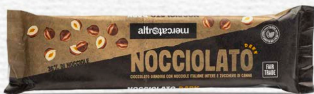
NOCCIOLATO DARK GIANDUIA E NOCCIOLE INTERE 125 GR