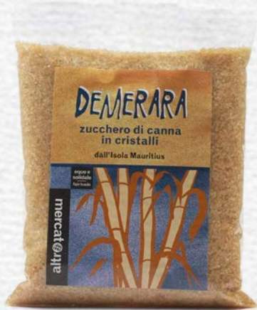
DEMERARA ZUCCHERO DI CANNA IN CRISTALLI 500 GR