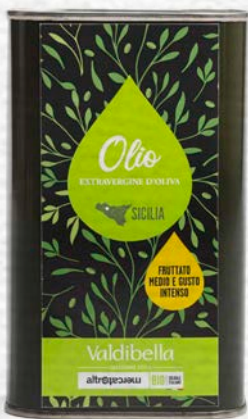
OLIO EXTRAVERGINE D'OLIVA SICILIA 500 ML