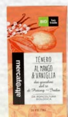
TÈ NERO MANGO E VANIGLIA 20 FILTRI BIO - 40 GR