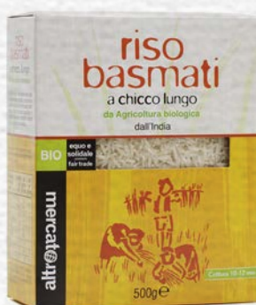
RISO BASMATI CHICCO LUNGO BIO - 500 GR