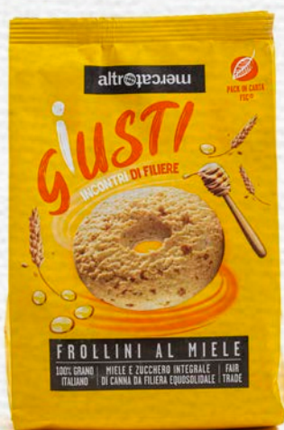
BISCOTTI AL MIELE 300 GR