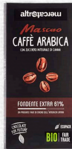
MASCAO CIOCCOLATO FONDENTE AL CAFFÈ ARABICA BIO 100 GR