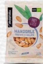
MANDORLE TOSTATE E SALATE BIO - 100 GR