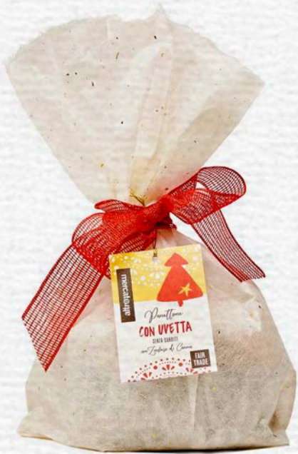
PANETTONE CON UVETTA SENZA CANDITI 700 GR