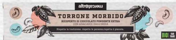
TORRONE MORBIDO RICOPERTO DI CIOCCOLATO FONDENTE BIO - 90 GR