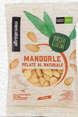
MANDORLE PELATE DI SICILIA BIO - 100 GR