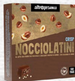
NOCCIOLATINI CRISP RIPIENI ALLA NOCCIOLA 120 GR