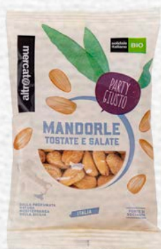
MANDORLE PELATE DI SICILIA BIO - 100 GR