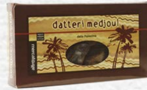
DATTERI MEDJOU AL NATURALE 200 GR