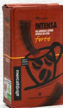
MISCELA INTENSA MACINATO PER MOKA 250 GR