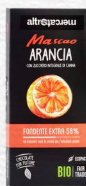
MASCAO CIOCCOLATO FONDENTE EXTRA ALL'ARANCIA BIO - 100 GR