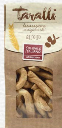
TARALLI ALL'OLIO EXTRAVERGINE D'OLIVA 250 GR