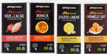
MASCAO CIOCCOLATO FONDENTE EXTRA - FAVE - ARANCIA - ZENZERO E LIMONE CIOCCOLATO AL LATTE - CON CARAMELLO E SALE BIO-100 GR