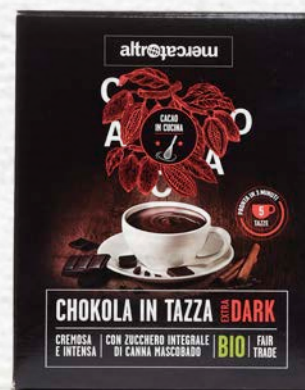
CHOKOLA - EXTRA DARK CIOCCOLATA IN TAZZA BIO 125 GR