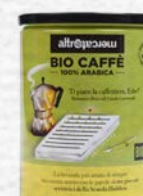
CAFFÈ 100% ARABICA IN LATTINA BIO - 250 GR