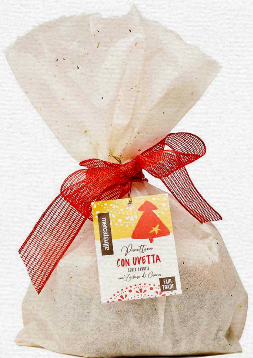
PANETTONE CON UVETTA SENZA CANDITI 700 GR