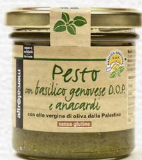
PESTO DI BASILICO DOP E ANACARDI 130 GR