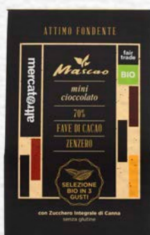
MASCAO - ATTIMO FONDENTE MINI CIOCCOLATO 3 GUSTI BIO - 130 GR