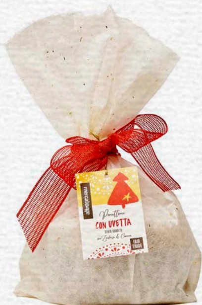
PANETTONE CON UVETTA SENZA CANDITI 700 GR