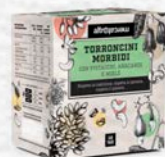
TORRONCINI MORBIDI PISTACCHIO E ANACARDI 120 GR