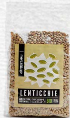
LENTICCHIE ESSICATE BIO 500 GR