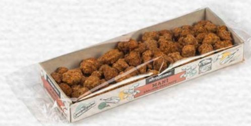
MANÌ ARACHIDI PRALINATE 100 GR