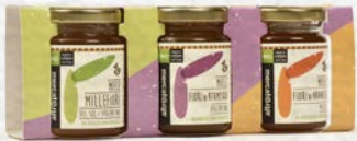
SELEZIONE DI MIELI MONOFLORA E MILLEFIORI BIO - 375 GR