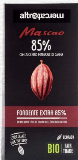
MASCAO CIOCCOLATO FONDENTE EXTRA 85% BIO 100 GR