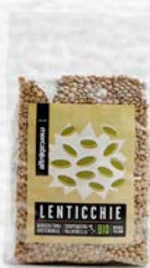
LENTICCHIE ESSICcate BIO 500 GR