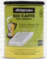
CAFFÈ 100% ARABICA IN LATTINA BIO - 250 GR