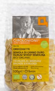
ORECCHIETTE PASTA DI SEMOLA BIO - 500 GR