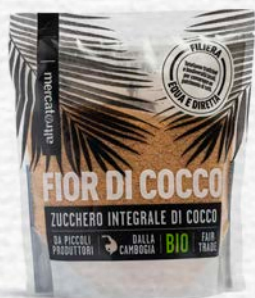
ZUCCHERO DI COCCO BIO - 250 GR