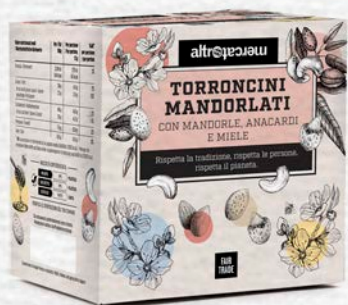
MANDORLATINI CROCCANTI CON MANDORLE E ANACARDI TOSTATI 120 GR