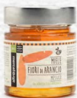
MIELE MONOFLORA FIORI D'ARANCIO BIO - 300 GR