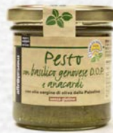
PESTO DI BASILICO DOP E ANACARDI 130 GR