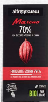
MASCAO CIOCCOLATO FONDENTE EXTRA 70% BIO - 100 GR