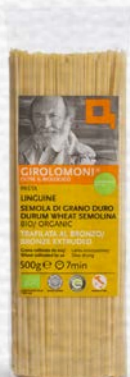
LINGUINE PASTA DI SEMOLA BIO - 500 GR