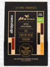
MASCAO - ATTIMO FONDENTE MINI CIOCCOLATO 3 GUSTI BIO - 130 GR