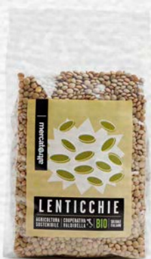
LENTICCHIE ESSICcate BIO - 500 GR