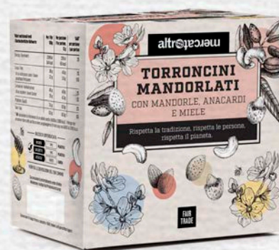
MANDORLATINI CROCCANTI CON MANDORLE E ANACARDI TOSTATI 120 GR