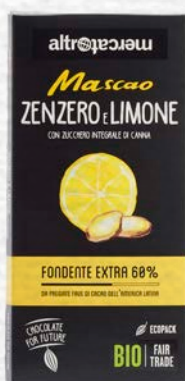
MASCAO CIOCCOLATO FONDENTE EXTRA ZEN- ZERO E LIMONE BIO - 100 GR