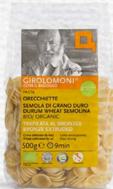
ORECCHIETTE PASTA DI SEMOLA BIO - 500 GR