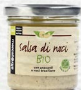
SALSA DI NOCI BIO - 130 GR