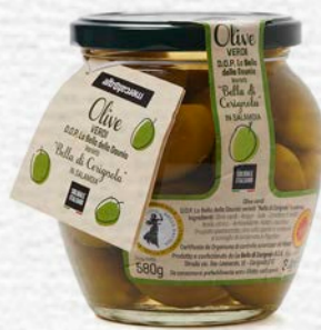
OLIVE VERDI BELLA DI CERIGNOLA IN ORCIO BIO - 580 GR