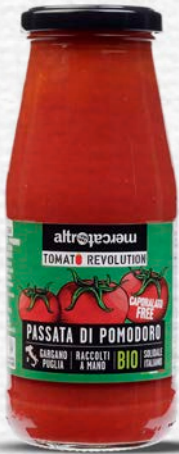
PASSATA DI POMODORO BIO - 280 GR