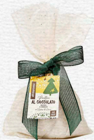
PANETTONE AL CIOCCOLATO CON GOCCE DI CIOCCOLATO 700 GR