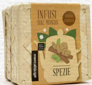
INFUSO DI SPEZIE CESTINO ARTIGIANALE 50 GR