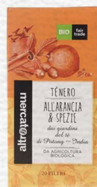
TÈ NERO ALL'ARANCIA E SPEZIE 20 FILTRI BIO - 40 GR