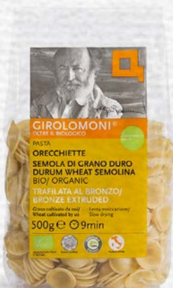
ORECCHIETTE PASTA DI SEMOLA BIO - 500 GR