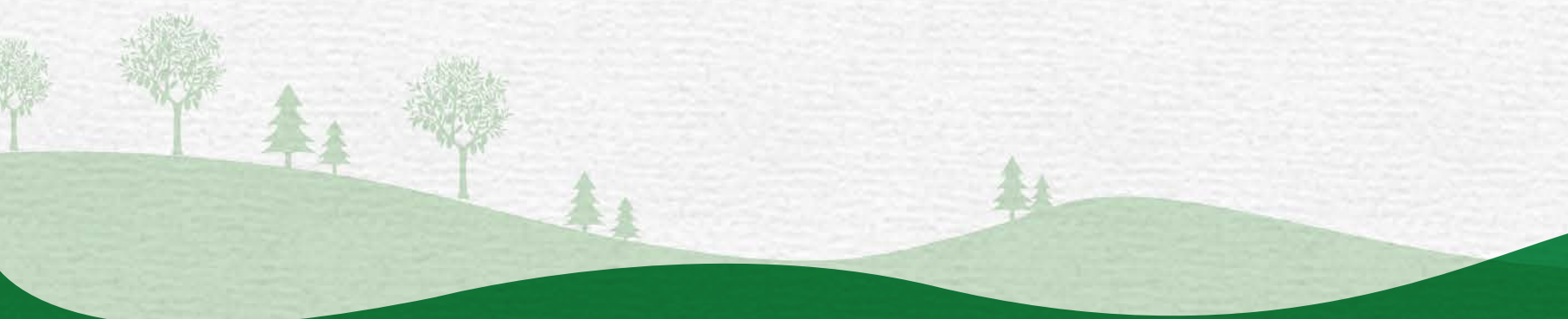
Art Direction: Simona Placci Copywriter: Federico Maria Leone Impaginazione: Giulia Gatti Progettazione: Marco Fiorentino