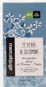
TÈ VERDE AL GELSOMINO 20 FILTRI BIO - 40 GR