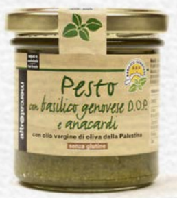
PESTO DI BASILICO DOP E ANAGARDI 130 GR