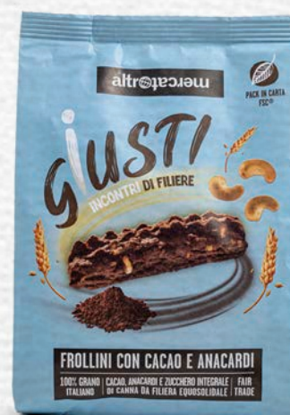
BISCOTTI CON CACAO E ANACARDI 300 GR