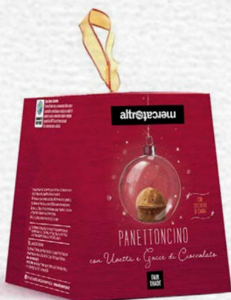
PANETTONCINO GOCCE DI CIOCCOLATO E UVETTA 100 GR