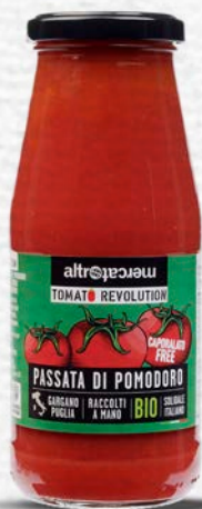
PASSATA DI POMODORO BIO - 280 GR