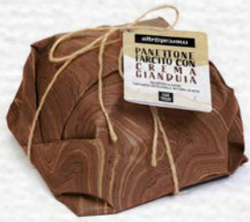
PANETTONE FARCITO CON CREMA GIANDUIA 750 GR