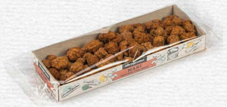
MANÌ ARACHIDI PRALINATE 100 GR