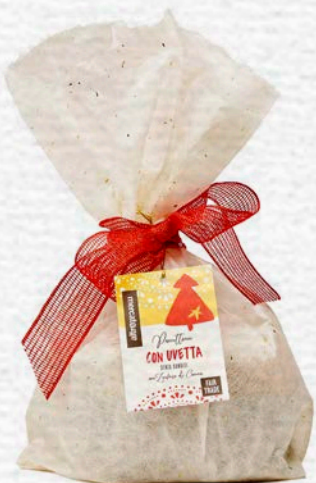
PANETTONE CON UVETTA SENZA CANDITI 700 GR