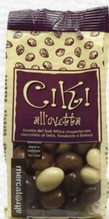
CIKI DI UVETTA RICOPERTI AL CIOCCOLATO 100 GR