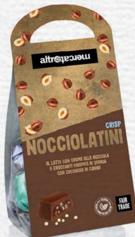
NOCCIOLATINI CRISP CIOCCOLATINI AL LATTE RIPIENI ALLA NOCCIOLA 120 GR