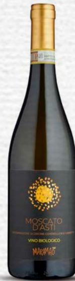
MOSCATO D'ASTI DOCG - SPUMANTE DOLCE BIO - 750 ML