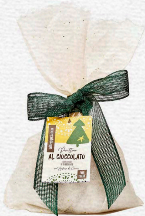
PANETTONE AL CIOCCOLATO CON GOCCE DI CIOCCOLATO 700 GR