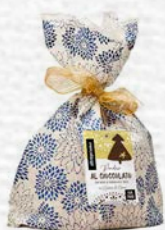
PANDORO AL CIOCCOLATO 750 GR