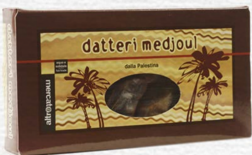
DATTERI MEDJOUL AL NATURALE PALESTINA 200 GR