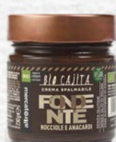
BIOCAJITA CREMA FONDENTE SENZA LATTE BIO - 230 GR