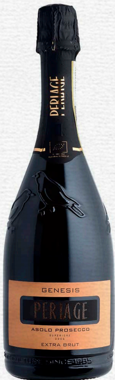
GENESIS - ASOLO PROSECCO SUPERIORE DOGG - EXTRA BRUT - BIO 750 ML