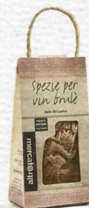
SPEZIE PER VIN BRULÈ 7,5 GR