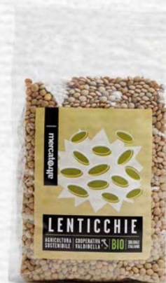
LENTICCHIE ESSICcate BIO 500 GR