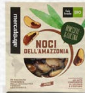
NOCI DELL'AMAZZONIA SGUSCIATE BIO - 150 GR