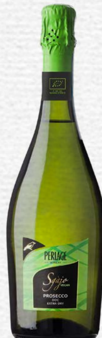
PROSECCO DOC EXTRA DRY VEGANO SGAJO BIO - 750 ML