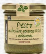
PESTO DI BASILICO DOP E ANACARDI 130 GR