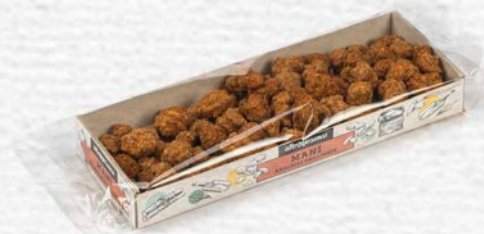
MANÌ ARACHIDI PRALINATE 100 GR