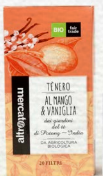
TÈ NERO AL MANGO E VANIGLIA 20 FILTRI BIO - 40 GR