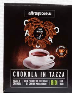
CHOKOLA CIOCCOLATA IN TAZZA BIO - 125 GR