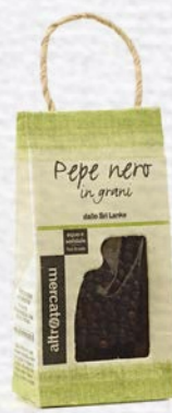
PEPE NERO IN GRANI 30 GR