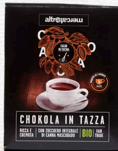
CHOKOLA CIOCCOLATA IN TAZZA BIO 125 GR