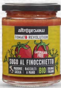
SUGO AL FINOCCHIETTO E POMODORO SICAGNO BIO - 280 GR