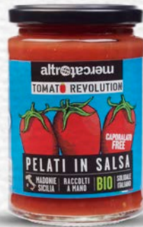
PELATI IN SALSА BIO 380 GR