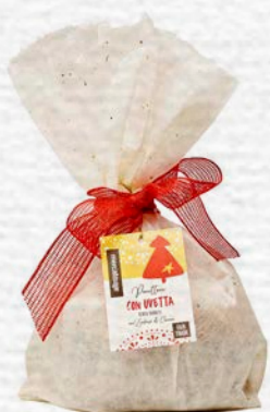
PANETTONE CON UVETTA SENZA CANDITI 700 GR