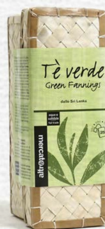
TÈ VERDE IN CESTINO - 25 FILTRI 50 GR