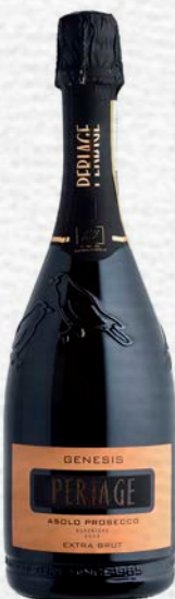
GENESIS - ASOLO PROSECCO SUPERIORE DOGC - EXTRA BRUT - BIO - 750 ML