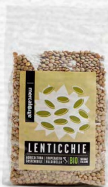
LENTICCHIE ESSICGATE BIO - 500 GR