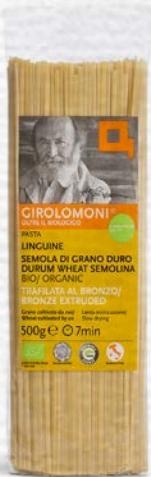
LINGUINE PASTA DI SEMOLA BIO - 500 GR