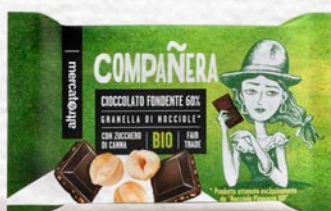
COMPAÑERA CIOCCOLATO FONDENTE EXTRA CON NOCCIOLE BIO - 100 GR