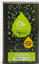
OLIO EXTRA VERGINE D'OLIVA SICILIA BIO - 500 ML