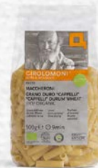
MACCHERONI GRANO DURO CAPPELLI - BIO - 500 GR