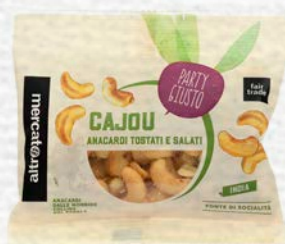
CAJOU ANACARDI TOSTATI E SALATI 50 GR