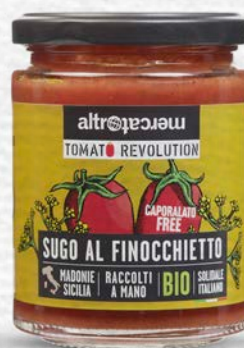
SUGO AL FINOCCHIETTO E POMODORO SICILIANO BIO - 280 GR