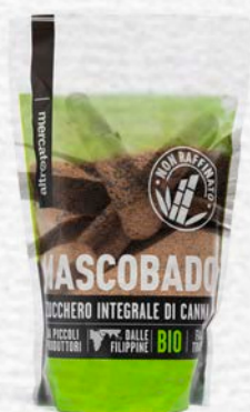
MASCOBADO ZUCCHERO INTEGRALE DI CANNA BIO - 500 GR