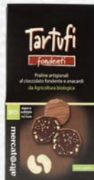
TARTUFI FONDENTI AGLI ANACARDI BIO - 120 GR