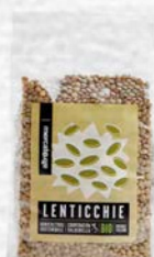
LENTICCHIE ESSICcate BIO 500 GR