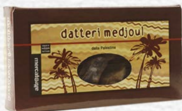
DATTERI MEDJOUL AL NATURALE PALESTINA 200 GR