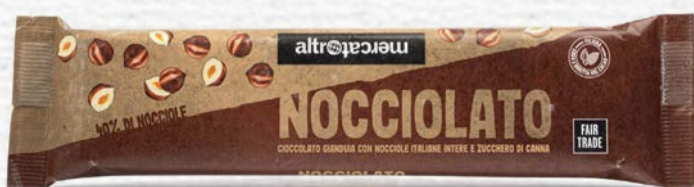
NOCCIOLATO GIANDUIA E NOCCIOLE INTERE 125 GR