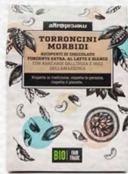
TORRONCINI RICOPERTI BIO - 180 GR